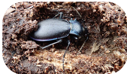
Osobnik zimujący w próchnie